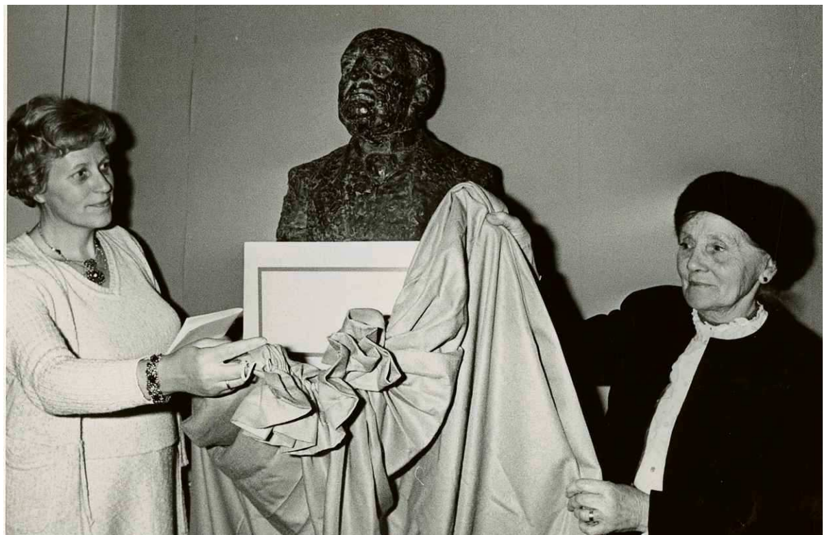
In Nederland was Abraham Kuyper zeer invloedrijk. In 1979 werd in het gebouw van de Tweede Kamer een borstbeeld van hem onthuld, bij het honderdjarig bestaan van zijn Anti-Revolutionaire Partij.

mist, wel erg gecharmeerd van de boeren in Zuid-Afrika, iemand die van de standpunten van anderen nog wel eens een karikatuur maakte), maar óók ziet dat Kuyper iets te zeggen zou hebben in het heden. Dat geldt in het bijzonder een in de basis van de samenleving gewortelde kerk, die vanuit die basis opereert in een democratisch bestel. Waarbij doen even belangrijk is als de theorie.”