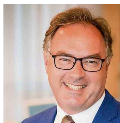
Hans-Georg Ulrichs.